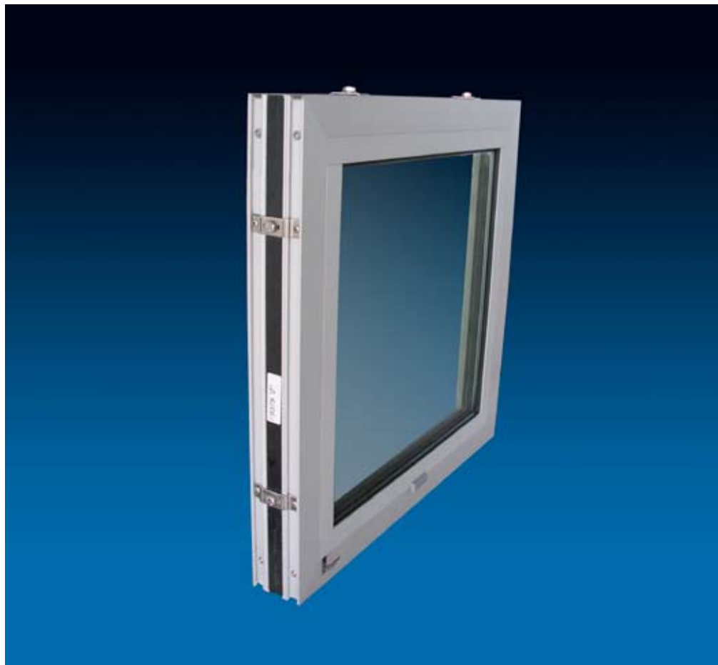
Skyddsfönstret uppfyller krav beträffande isolation, brandskydd, personskydd, elektromagnetiskt och mekaniskt skydd.